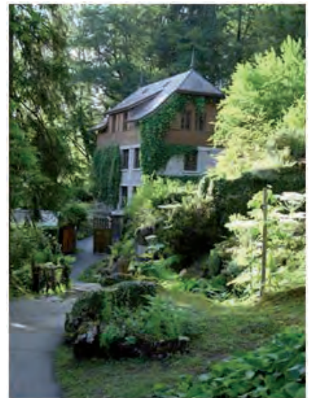
Le jardin botanique