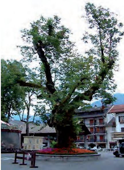
Le tilleul planté en 1438