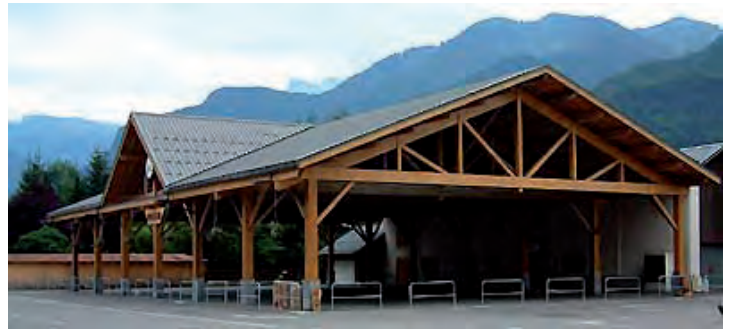
La patinoire, place du marché