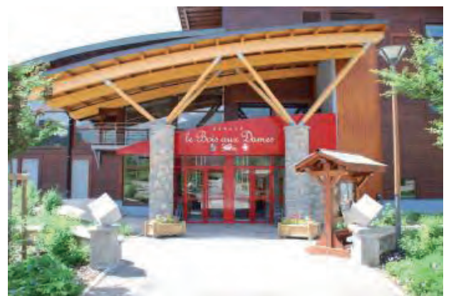
Le centre culturel et sportif Le Bois aux Dames