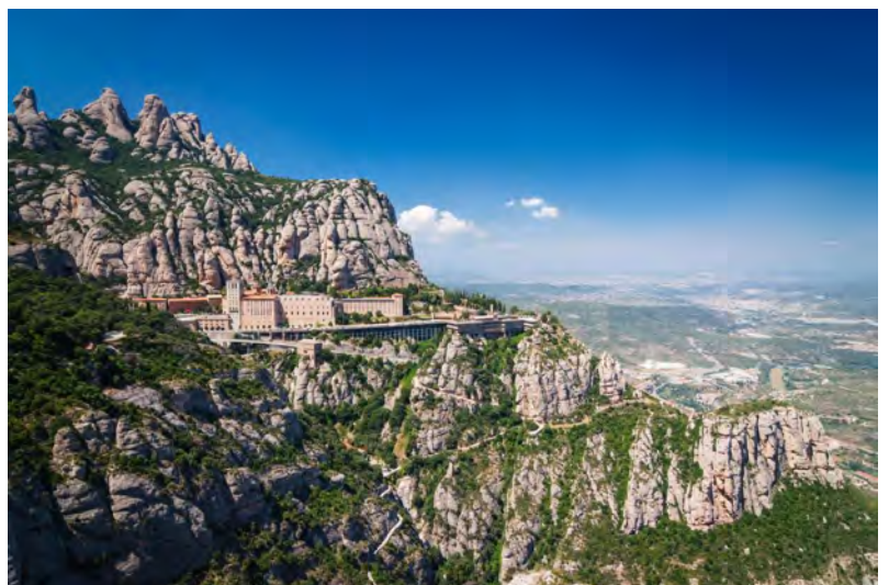
Abbaye de Montserrat

Nous évoquerons le chemin de St-Jacques de Compostelle, la cour magique d'Alfonso el Sabio, le monastère de femmes de Las Huelgas à Burgos, el Llibre Vermell de Montserrat, la cantillation mauresque à Granada et tant d'autres lieux incontournables des Pyrénées à la pointe de Cadix.