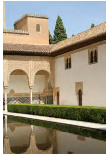
Alhambra - Grenade