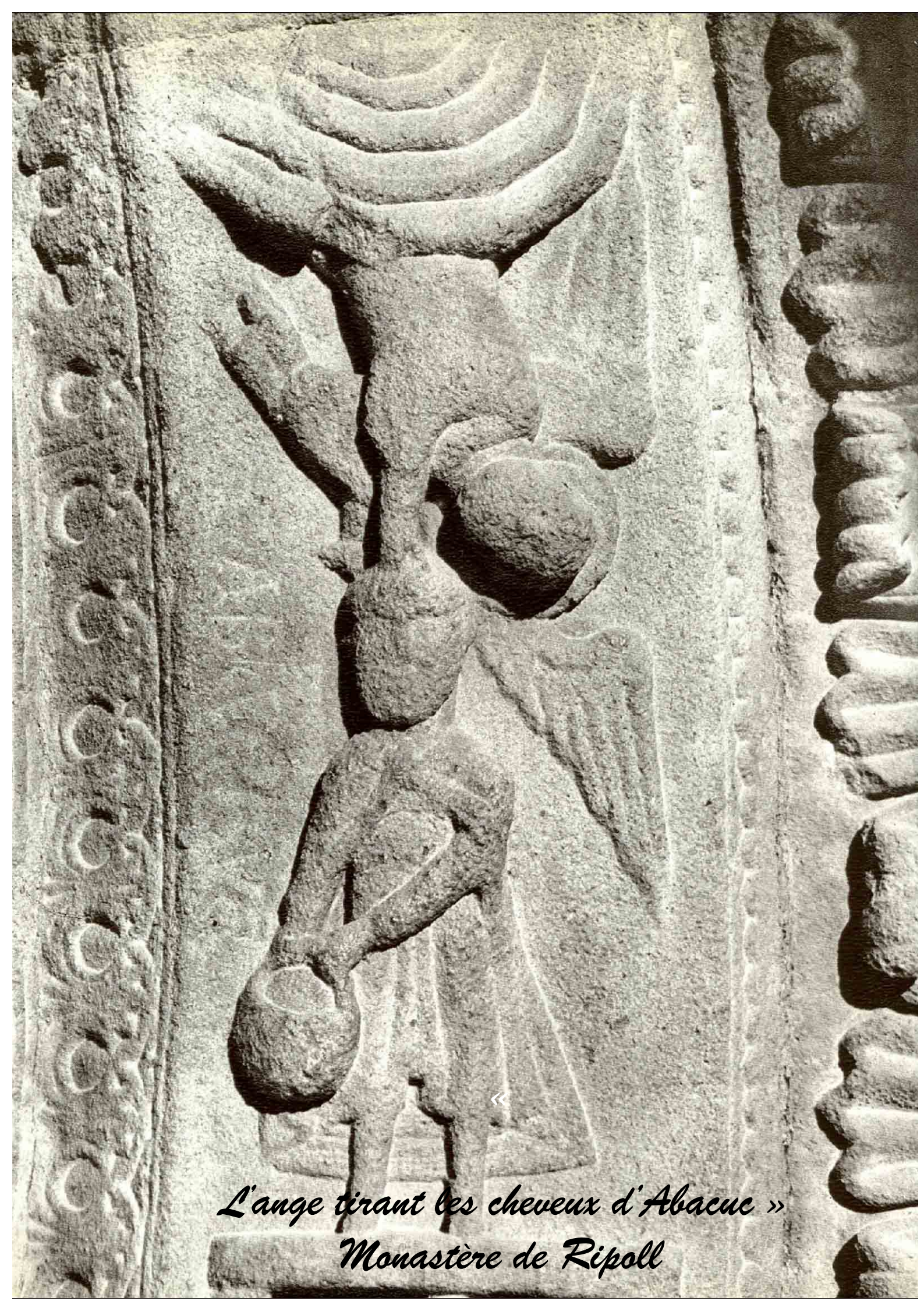
« L'ange tirant les cheveux d'Abacuc » Monastère de Ripoll