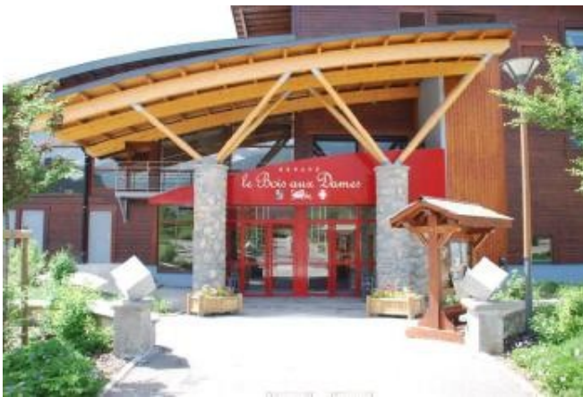
Le Centre culturel et sportif Bois aux Dames