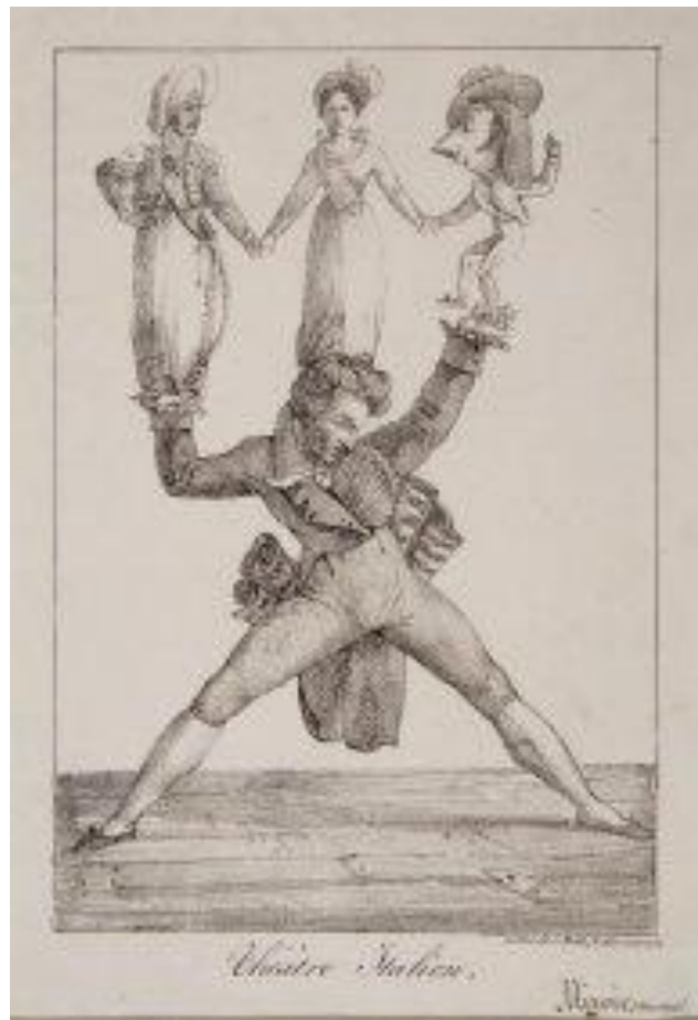
Rossini soutenant à lui seul tout l'opéra italien. Eugène DELACROIX